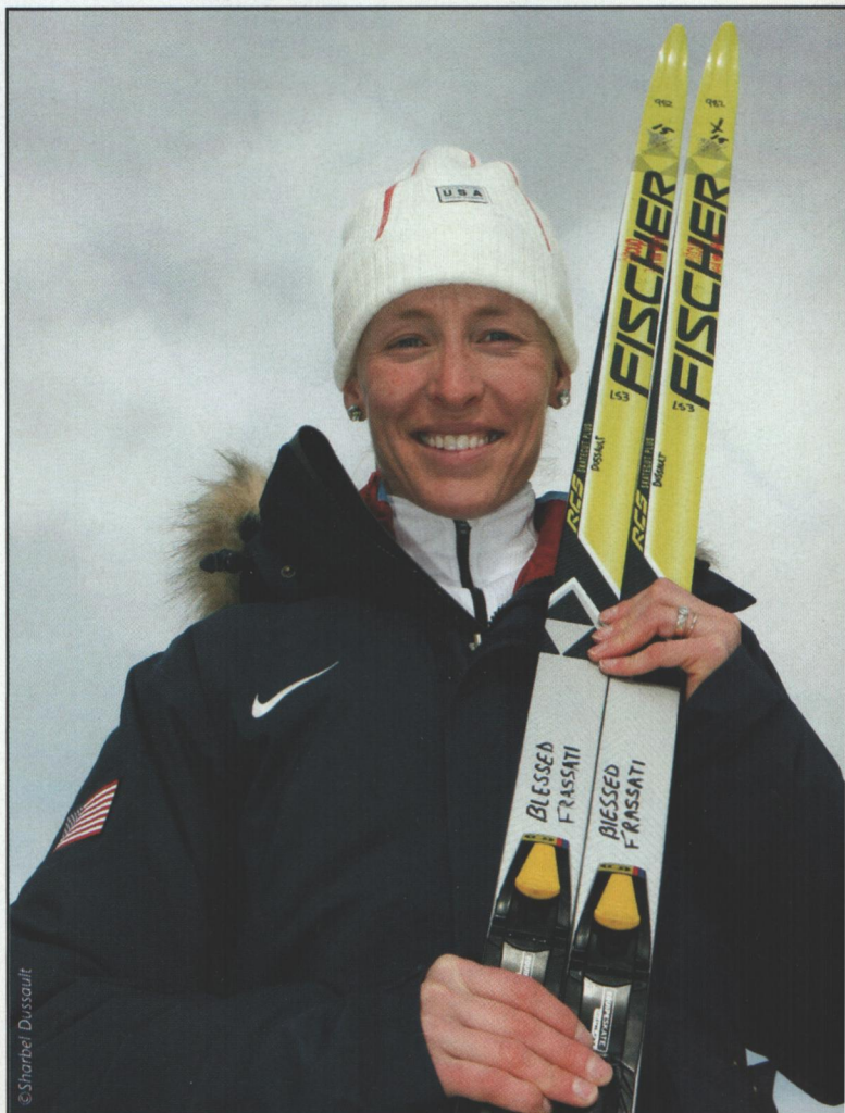
Sur ses skis, l'inscription "Bx. Frassatti" saint patron de son aventure olympique.